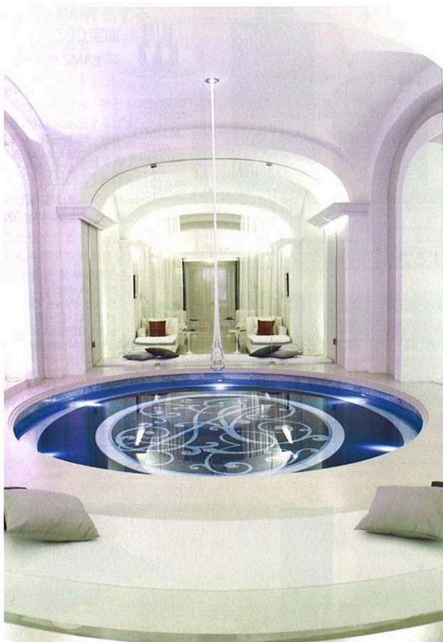
大きな水盤は、贅沢なくつろぎの時間を象徴するよう。向こう側には休憩室が。

シックな内装。カップルや友だち同士で利用できるダブルキャビンがあるのもうれしい。新技術マイクロアブレーションを取り入れたアンタンス・ジュネスのほか、ジェットラグ対策の特別メニュー、75ミニッツクロノもおすすめ。