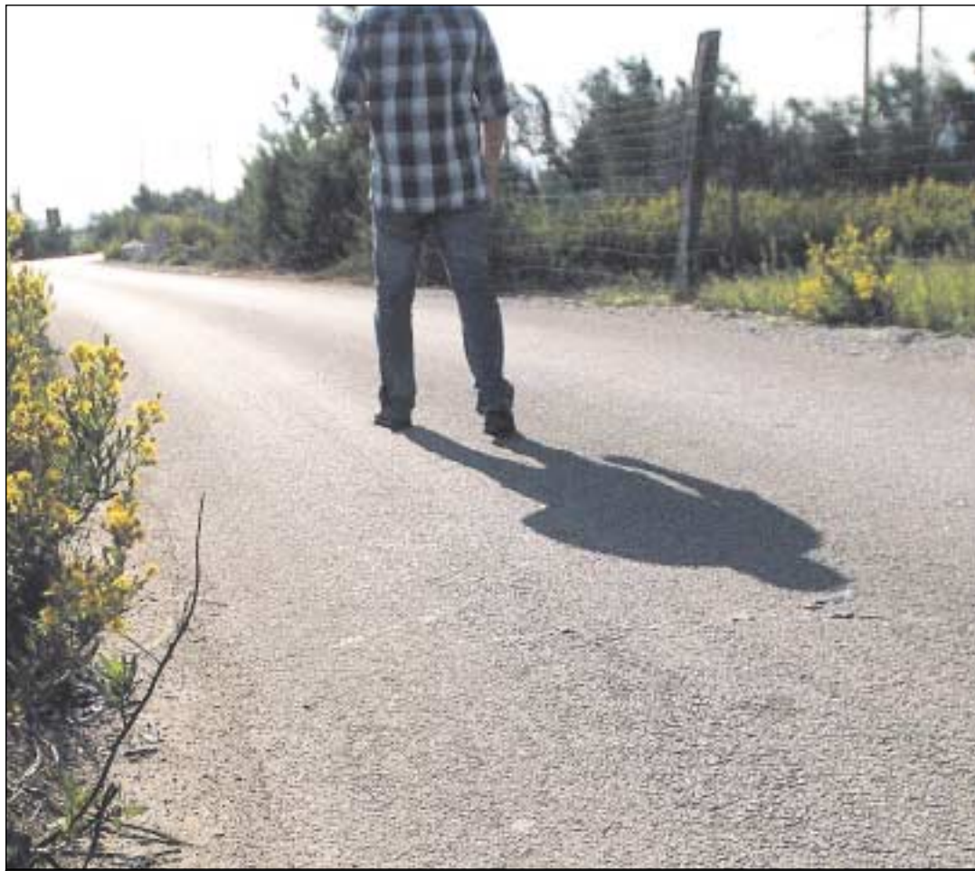
Il a été arrêté en août près de ce chemin, vers la plage de Port-la-Nouvelle.