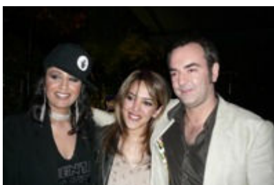
Lââm, Hoda et Bruno Solo

De nombreuses personnalités étaient là pour soutenir l'initiative de Mathieu Johann, pour partager ce moment émouvant et témoigner auprès des médias combien la cause de l'enfance violée et bafouée leur tenait à coeur. L'enthousiasme des artistes, leur mobilisation et les messages qu'ils ont fait passer ont fortement marqué cette soirée.