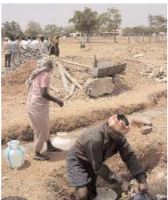
Au premier plan, construction d'un nouveau bâtiment à Karur ; au loin, 3 premières salles de classes ont vu le jour

- Evaluer l'avancée du programme de construction d'une école à Karur, dont la phase 1 est terminée : 93 élèves ont pu effectuer leur rentrée au sein des 3 niveaux de primaires ouverts.