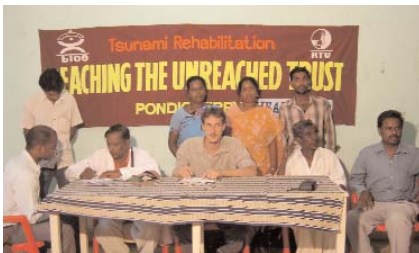
Visite du Camp médical à Sollainagar organisé par le partenaire indien du BICE

- Visiter les programmes post tsunami des associations soutenus financièrement par la Voix De l'Enfant le long de la côte orientale du Golfe du Bengale afin de faire une évaluation globale des actions entreprises et de leur impact sur les populations locales.