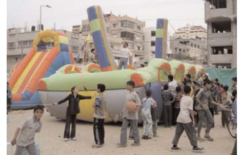
Animation de quartier à Gaza

Moment féérique, dans un quartier où le Ludobus s'était posé : musique, jeux, animations, goûter, tout est au rendez-vous pour redonner aux enfants traumatisés par les conditions de vie, la guerre, l'absence d'ouverture vers l'extérieur, un moment d'enfance heureuse. Les parents étaient là profitant aussi pleinement de cette fête avec leurs enfants. Cette idée merveilleuse a pu se concrétiser grâce à l'Association Un Enfant, Une Promesse.