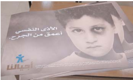
Campagne de sensibilisation de la Fondation de la Reine Rania

A Amman, nous avons été chaleureusement accueillies par l'Equipe de la Fondation de la Reine Rania. Une visite des lieux et une présentation des activités de prise en charge des enfants victimes de mauvais traitements nous a permis de prendre la mesure des actions de protection et de prévention menées par la Fondation.