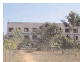
Bâtiment qui sera réhabilité pour l'école de formation à Pondichéry

Après l'aide d'urgence aux victimes du tsunami (forage de puits, distribution de nourriture, réparation de bateaux de pêche et achat de nouveaux bateaux à moteur avec leur kit de filets de pêche, organisation de séances de théâtre pour expliquer aux villageois le phénomène du tsunami), EDM-Enfants du Monde et son partenaire local EDM Enfants du Monde - Inde sont en train de créer une structure " Dispensaire-Crèche-Ecole de soutien " dans deux villages de pêcheurs au Nord de Pondichéry. Une école de formation professionnelle devra commencer son activité fin septembre et proposer à des jeunes adolescents, sortis pour diverses raisons du système scolaire, des métiers dérivés de la pêche ainsi que des formations de broderie, de couture, d'hôtellerie et des cours d'anglais.