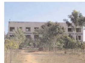
Bâtiment qui sera réhabilité pour l'école de formation à Pondichéry

Après l'aide d'urgence aux victimes du tsunami (forage de puits, distribution de nourriture, réparation de bateaux de pêche et achat de nouveaux bateaux à moteur avec leur kit de filets de pêche, organisation de séances de théâtre pour expliquer aux villageois le phénomène du tsunami), EDM-Enfants du Monde et son partenaire local EDM Enfants du Monde - Inde sont en train de créer une structure " Dispensaire-Crèche-Ecole de soutien " dans deux villages de pêcheurs au Nord de Pondichéry. Une école de formation professionnelle devra commencer son activité fin septembre et proposer à des jeunes adolescents, sortis pour diverses raisons du système scolaire, des métiers dérivés de la pêche ainsi que des formations de broderie, de couture, d'hôtellerie et des cours d'anglais.