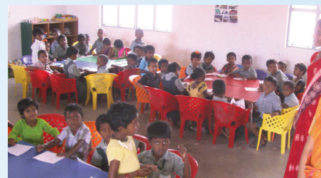
Elèves de l'école de Karur, en Inde